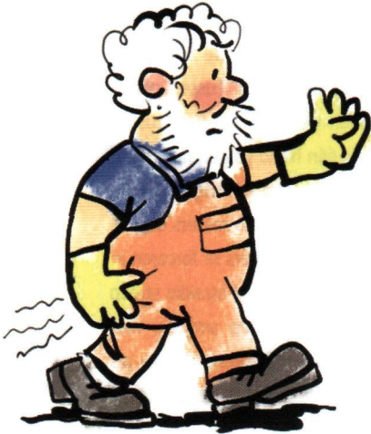
Illustratie's: Demian Geerlings.