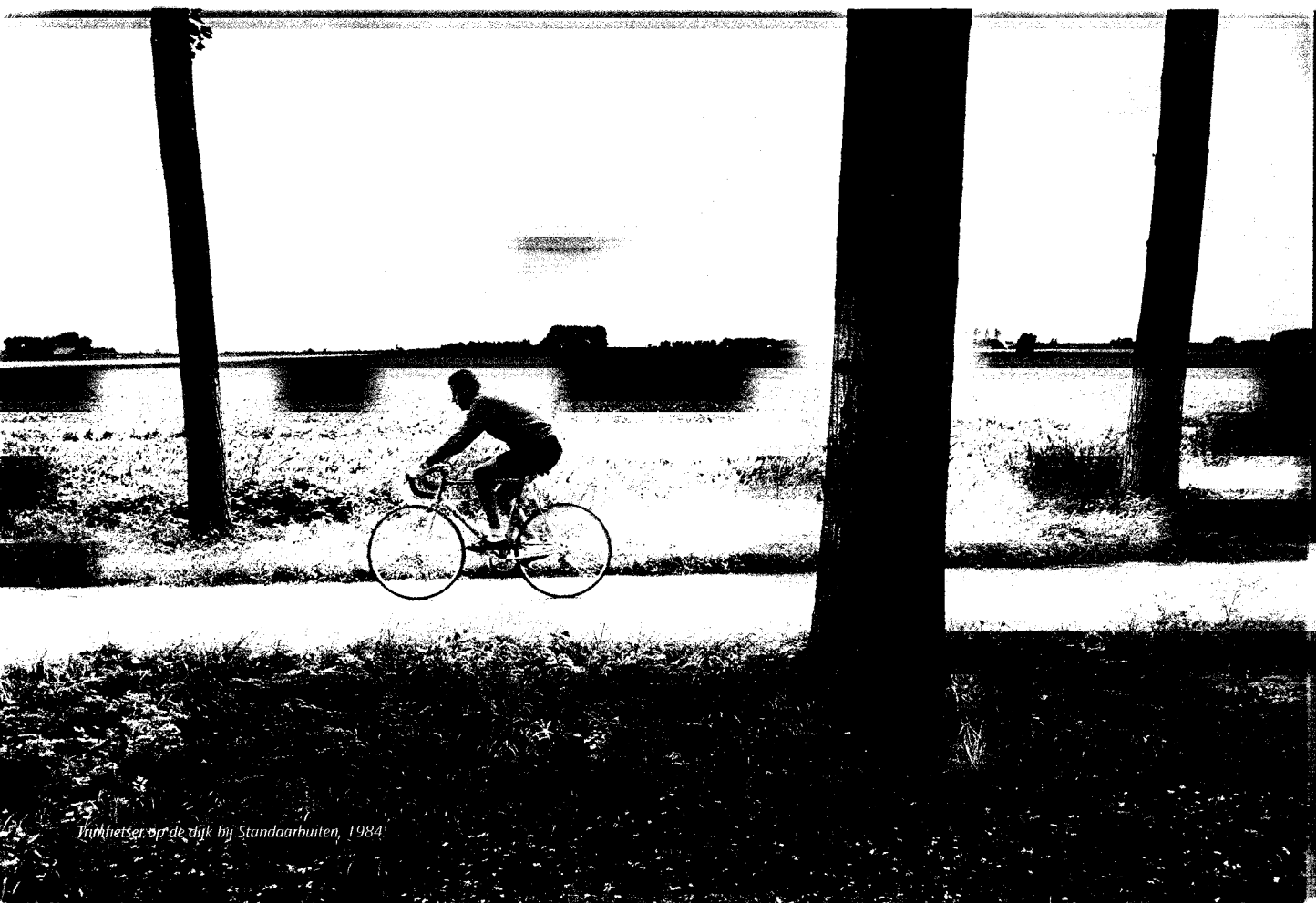
Frankfurter op de dijk bij Standaardbuiten, 1984