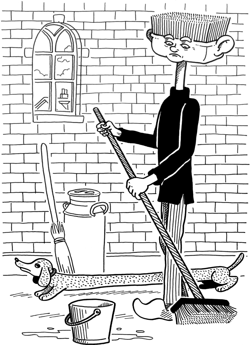
Die eej n'n bessem ingeslikt.