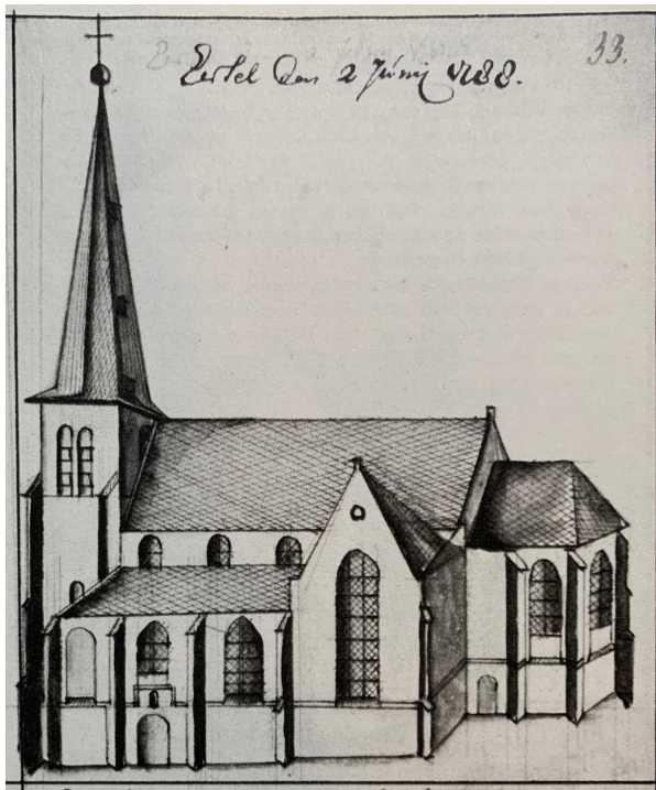
Uit het Schetsenboek van Hendrik Verhees

Van de schuurkerk is tot heden nog een deel van den oostelijken muur (dus naar den kant der dorpstraat) aanwezig, welke als tuin of heining veranderd werd.